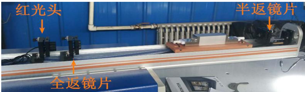
调整上图红光头、全返镜片、半返镜片用以调整光路